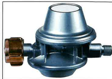
Bild 3 Druckregelgerät („S2SR“) zum Anschluss an 11 kg Flüssiggasflasche