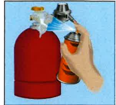
Bild 5 Dichtheitsprüfung der Anschlussverbindung