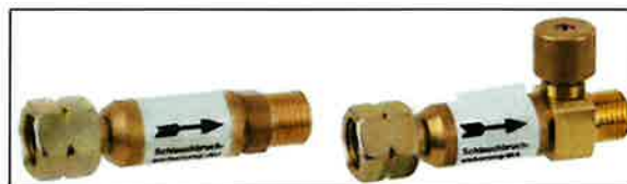
Bild 4 Schlauchbruchsicherungen